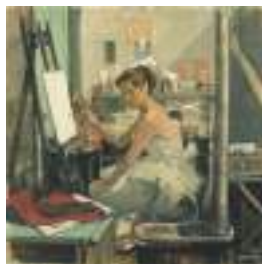
小磯良平《室内のパレリーナ》 1967年 神戸市立小磯記念美術館蔵

小磯良平や神戸ゆかりの画家約20名の“視線”をテーマにした作品をまとめて展示します。