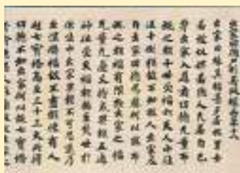
国宝「賢愚経」日本・奈良時代