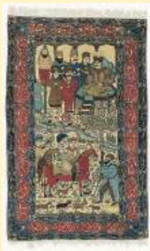
モフタシャム・カシヤン・バルシア中央部1900年頃