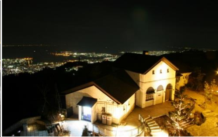
見晴らしの塔からの景色