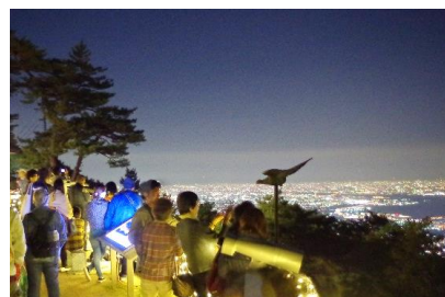
夜景ガイドツアー(イメージ)

阪神電気鉄道株式会社(本社:大阪市 社長:藤原崇起)のグループ会社である、六甲山観光株式会社(本社:神戸市 社長:宮西幸治)は、2017年1月7日(土)から3月18日(土)に六甲山上の夜景スポットを巡る“ケーブルカーで行く「六甲山1000万ドルの夜景ガイドツアー」”を実施します。