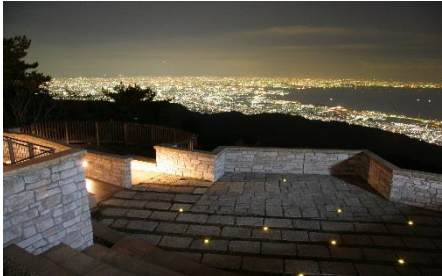
見晴らしのテラスからの景色

☆六甲ガーデンテラス 【1月】18:10～【2月】18:50～【3月】19:10～