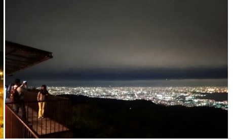
見晴らしのデッキからの景色

明石海峡や神戸市街地、大阪平野、紀伊半島など、大パノラマの景色を楽しめるビュースポット。エリア内には主に3つの展望スポットがあり、それぞれの場所で違った景色を楽しむことができる。関西にある3つの空港(大阪国際空港、関西国際空港、神戸空港)を離発着する飛行機も見ることができる。