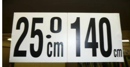
ブーツ25cm専用の140cmスキー板