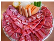
※写真は 4 人前です