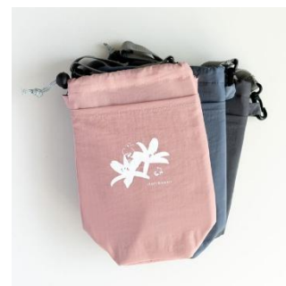
スイッチショルダー ¥1,980-(税込)