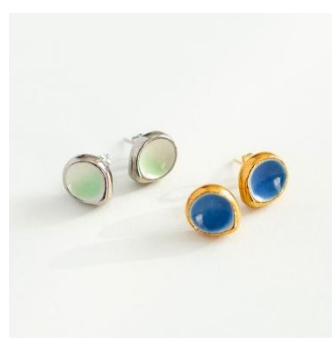
植物園限定色のピアス・イヤリング ¥5,500-(税込)

植物園に咲く「ヒマラヤの青いケシ」「エーデルワイス」をイメージした花びより限定色