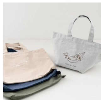
2WAY トートバッグ ¥1,980-(税込)