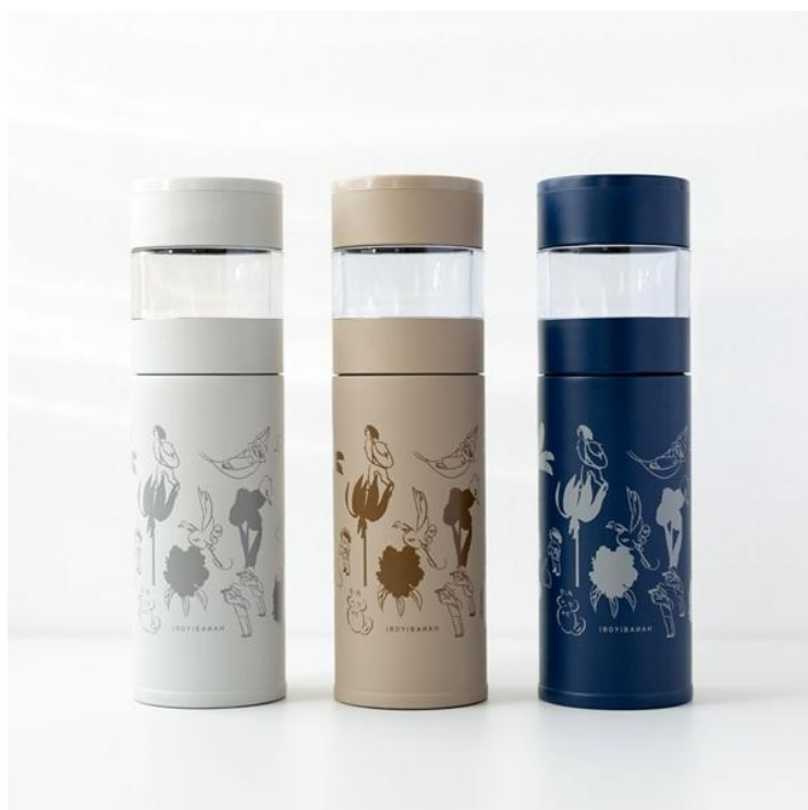
淹れたてティータイムボトル ¥3,960-(税込) 好きな時に淹れたてのお茶を楽しめる水筒