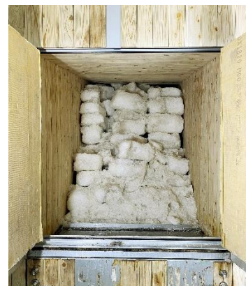
3月4日(月)時点の 氷室内部の様子

【備考】 普段は非公開の氷室内部を見学できる、年に1度の貴重な機会です。また、見学後はSNSで話題のイベント「パワーワード展」も無料で鑑賞いただけます。是非、この機会にお越しください。