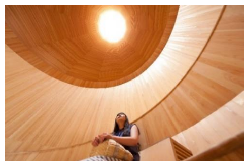
「風室」の天井部分から空気が排出される。