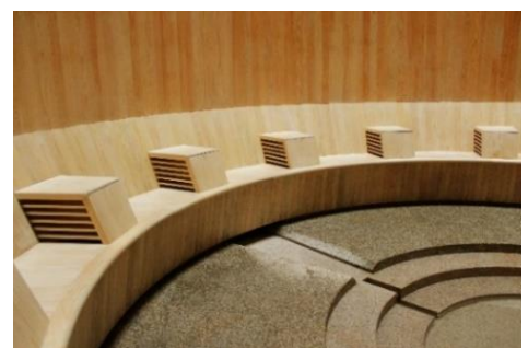
椅子のヒジ置き部分から冷風が取り込まれる。