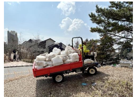
3月4日(月)に行った「ゲレンデの切り出し」の様子

毎年、六甲枝垂れの開業日である7月13日になると、氷を貯蔵した「氷室」の扉を開放し、六甲山上に吹く風を取り込む「氷室開き」を行います。氷室を通った風は冷気となり、展望台内部の「風室(ふうしつ)」にある椅子のヒジ置き部分から風室内へ取り込まれます。風室内は神戸市街地と比べて約10度気温が低く、ヒノキの香りと共にひんやりと心地良い空間が広がります。この電力を一切使用せずに、自然の力だけで涼が楽しめる体験が「冷風体験」です。