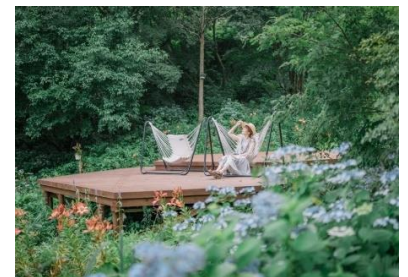
「SIKI ガーデン～音の散策路～」のアジサイとチェアモック

※価格は全て税込みです。金額の記述のないイベントは、入場料のみで参加できます。また、急遽内容を変更する場合があります。最新情報は HP をご覧ください。