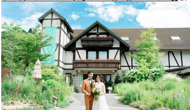
森の音ホール エントランス

六甲山観光株式会社(本社:神戸市灘区 社長:寺西公彦)が運営する、ROKKO森の音ミュージアムでは、2024年4月1日(月)～2025年3月31日(月)に株式会社 node と共同で新たなウェディングフォトプラン「美しい森の中で叶うロケーションフォト【ROKKO 森の音ミュージアム】」を実施します。