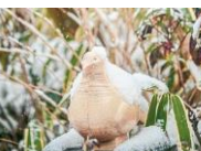
雪景色の音の展示