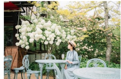
森の Café テラス席のオオデマリ