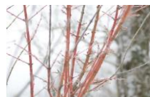
赤くなったモミジの枝

樹形や木の実など、植物の冬の姿が楽しめます。また、神戸市街地では珍しい雪景色が鑑賞できることもあります。