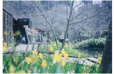
ヒツジグサの池周辺のスイセン