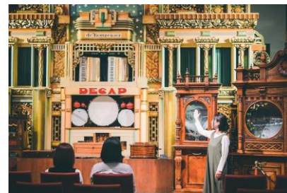
コンサートの様子(イメージ)

※混雑状況やコンディションにより、「演奏家のいないコンサート」「特集タイム」の時間、内容を急遽変更する場合があります。