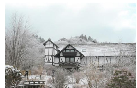
雪景色の森の音ホール

※イベント内容を変更する場合があります。また植物の見頃は気候により変動します。最新情報はホームページをご覧ください。