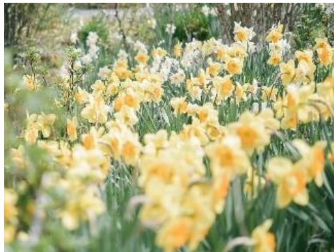
スイセン(3月中旬～4月下旬)