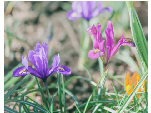
ミニアイリス(3月下旬～4月初旬)