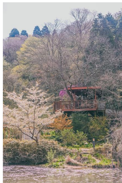
SIKI ガーデン ツリーハウスとオオシマザクラ