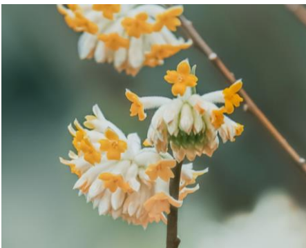
ミツマタ(4月初旬～4月下旬)