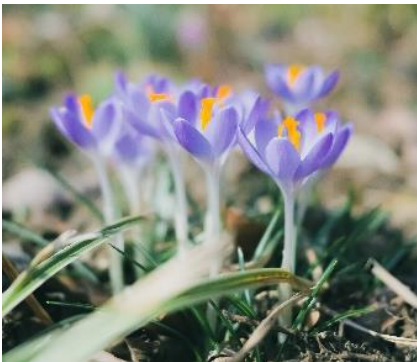
クロッカス(3月初旬～4月初旬)