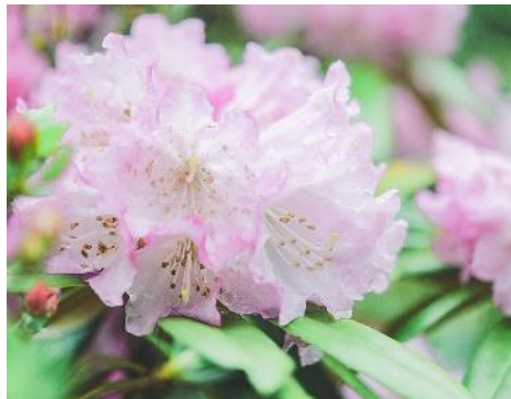
シャクナゲ(4月中旬～5月初旬)