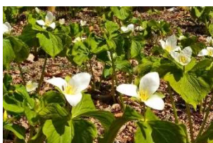
オオバナノエンレイソウ(4月)