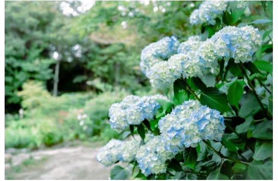
盛夏のSIKIガーデンアジサイの群生