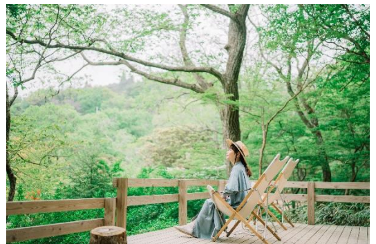
チェアリング(イメージ)

アウトドア用の折り畳みチェアを持ち運んで、好きな場所を見つけてゆっくりくつろぐこと。