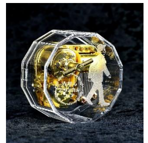
限定デザイン神戸オルゴール 4,530円(税込)