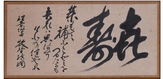
牧野博士筆 扁額 (樋口清一氏提供)