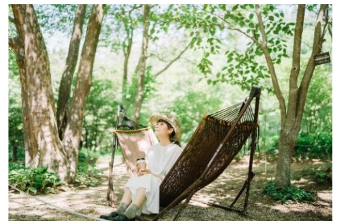
ハンモックカフェ(イメージ)