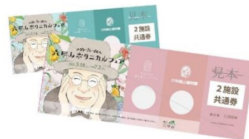
2施設共通券 限定デザイン