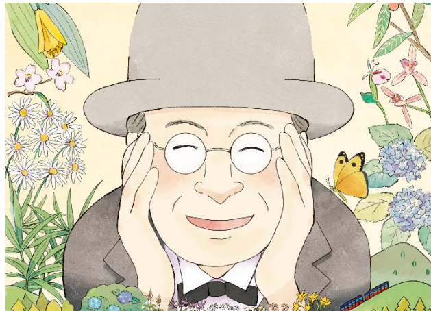
六甲山ポタニカルフェア イベントメインビジュアル