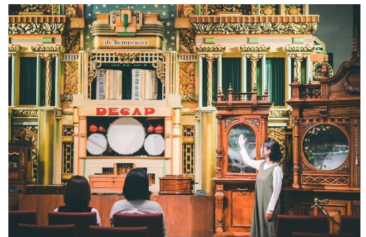
コンサートの様子

※8月11日(金・祝)～15日(火)の期間は毎時00分～、30分～(各回約20分間、最終回は16:00)