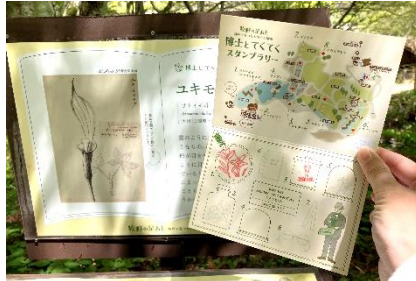
スタンプラリー(イメージ)