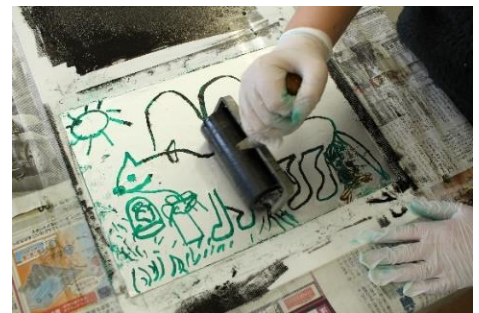
キッチンリトグラフ(イメージ)