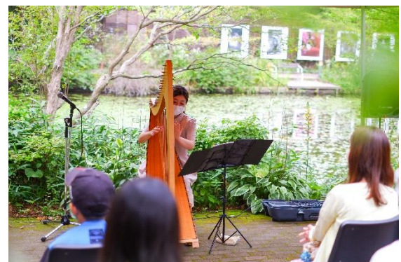
コンサートの様子

※新型コロナウイルス感染症の状況により、臨時休場、イベント内容を変更する場合があります。最新情報はホームページをご覧ください。