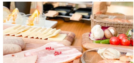
ラクレットチーズグリルセット