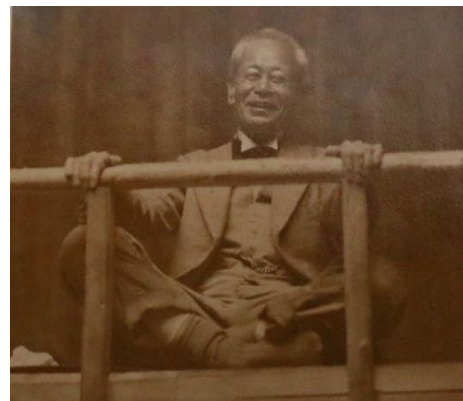
牧野富太郎博士 六甲高山植物園にて撮影