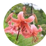
シャンデリア リリー