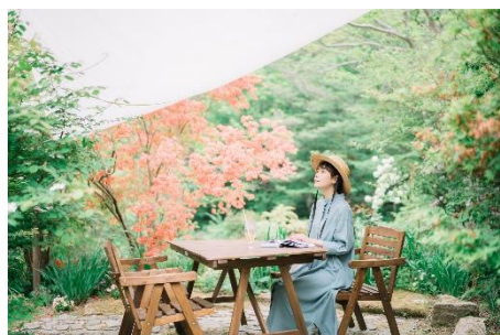
ヤマツツジとテラス席

◆盛夏 池一面にジュンサイやアサザが広がり、日本の在来種のスイレンの仲間「ヒツジグサ」が見頃を迎えます。7月上旬はバラ、中旬はユリやヤマアジサイも見頃を迎え、バラやユリは様々な種類が植栽され、7月下旬まで楽しむことができます。