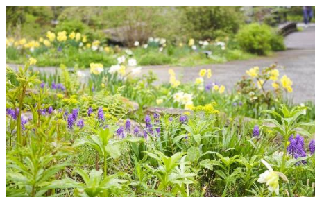
エントランス ムスカリとスイセン

◆初夏 SIKI ガーデン内「せせらぎのメドウ」エリアでは、カマシアやクリンソウが咲き始め、あたり一帯を彩ります。森の Café では窓一面に咲くオオデマリを鑑賞でき、テラス席ではヤマツツジを背景にお茶や食事を楽しむことができます。また、6月下旬にはバラも咲き始めます。