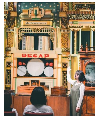
コンサートの様子