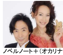
ノベルノート+(オカリナ)

SIKI ガーデンにおいて、5～10月の毎週日曜日に各日1組の演奏家をお招きし「SIKI ガーデンコンサート」を開催しています。7月、8月はオカリナやティンホイッスル、クラシックギター、サクスのジャズ演奏など、ジャンルを問わず様々な楽器の生演奏をお楽しみいただけます。