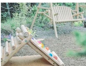
キッズマウンテン

SIKI ガーデン内に、未就学児を対象としたキッズコーナーを設置しました。丸太から丸太に飛び移る「丸太ステップ」や幼児用ボルダリング「キッズマウンテン」など、木材を中心に自然素材を使用した温かみ溢れる遊具や、楽器を設置しています。叩いたり、耳に当てたりなど、ハンズオンで楽しむ展示により知育教育を促進します。