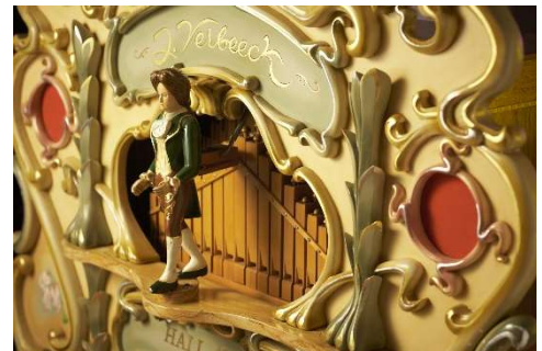
フェルバーク40key手回しオルガン(部分) (1994年、ベルギー製)