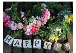
バースデーグッズ(イメージ)