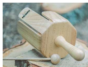
木のくるくる楽器