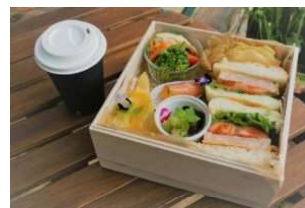
森の Café お手製ランチボックス