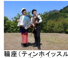
鞆座(ティンホイッスル & アコーディオン)