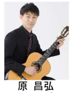
原 昌弘(クラシックギター)