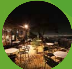
TENRAN CAFE (天覧台)