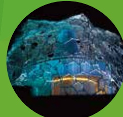
自然体感展望台 六甲枝垂れ した