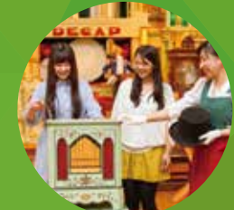
ROKKO 森の音ミュージアム