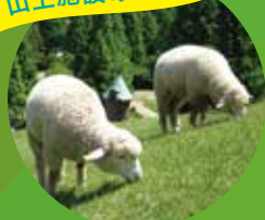
神戸市立 六甲山牧場