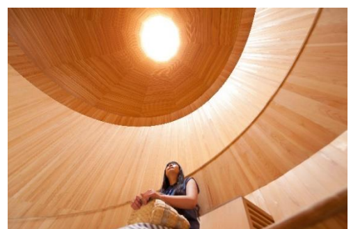
「風室」の天井部分から空気が排出される。