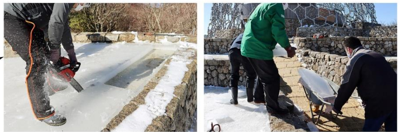
①「氷棚」にできた天然の氷を切り出し、運び出します。

夏になると氷を貯蔵した「氷室」へ六甲山上に吹く風を取り込み、展望台内部の「風室(ふうしつ)」に循環させ、電力を一切使用せずに自然の力だけで涼を楽しめる「冷風体験」を実施いたします。「氷室」を通った冷たい風は「風室」にある椅子のヒジ置き部分から室内へ取り込まれます。真夏でも風室内は20℃程度に保たれ、ヒノキの香りと共にひんやりと心地良い空間が広がります。