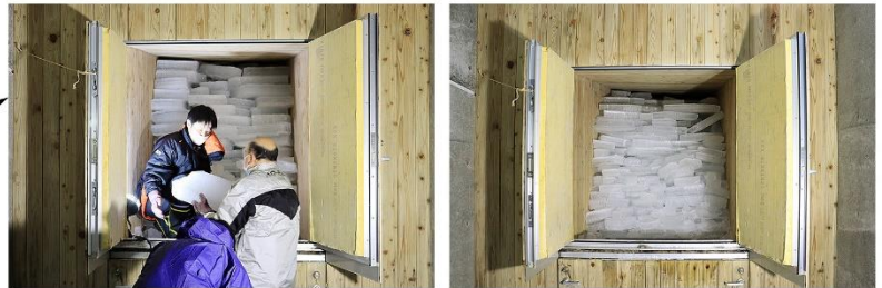
②展望台内部にある「氷室」に運び、夏まで氷を貯蔵します。