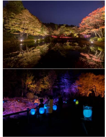
(下) Glow with Night Garden Project in Rokko 提灯行列ランドスケープ 2019

※六甲ミーツ・アート 芸術散歩 2021 鑑賞パスポート及び、各種共通券でも入園可能です。