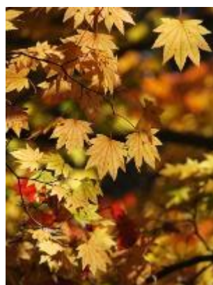
コハウチワカエデ