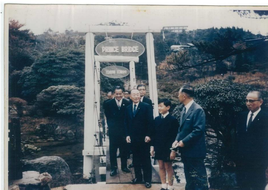
1971年11月10日 徳仁皇太子殿下(当時)