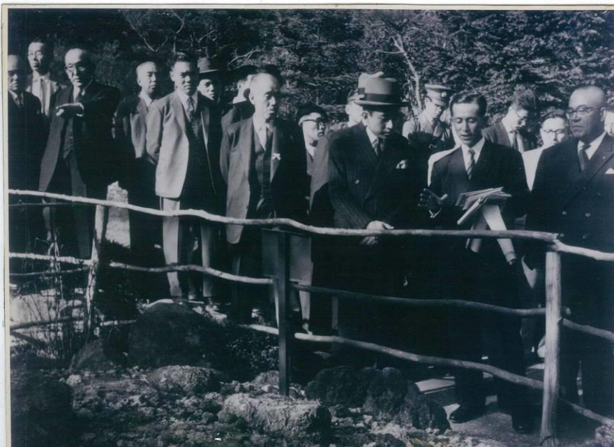
1958年10月29日 明仁皇太子殿下(当時)