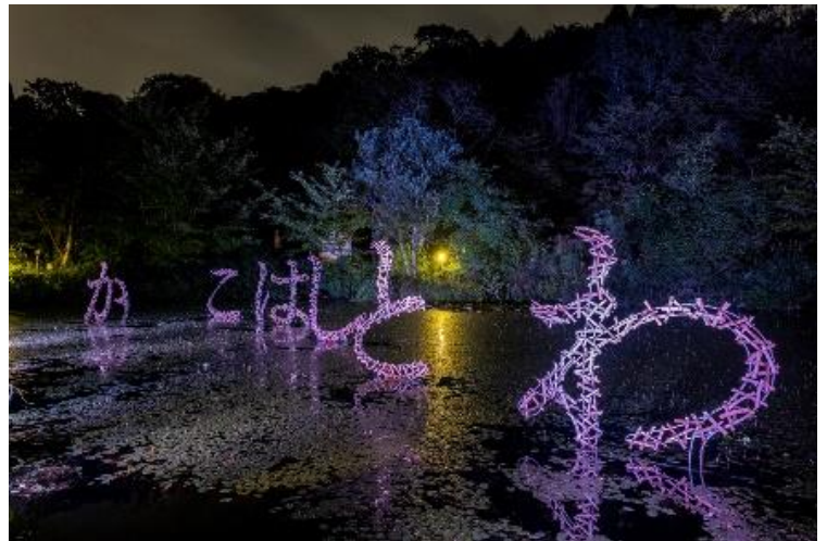
伏見雅之「過去とはどこか」2020年 六甲オルゴールミュージアム 撮影:高嶋清俊

下記期間中、ムットーニの作品上演に加え、「六甲ミーツ・アート 芸術散歩 2020」の野外アート作品をライトアップします。期間限定で夜間のみ鑑賞できる作品の展示も行います。1000万ドルの夜景が楽しめる時間帯にアート作品が鑑賞できます。