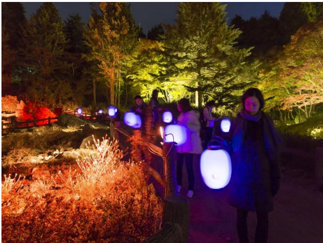
高橋匡太「Glow with Night Garden Project in Rokko 提灯行列ランドスケープ」2019年 六甲高山植物園