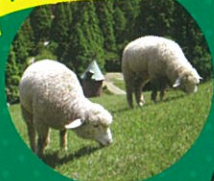
神戸市立 六甲山牧場