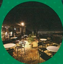
TENRAN CAFE (天覧台)