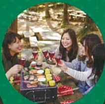
六甲山 カンツリーハウス