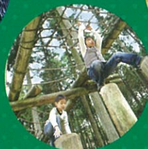
六甲山 フィールド・アスレチック