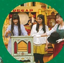
六甲オルゴール ミュージアム