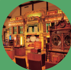
ROKKO 森の音ミュージアム