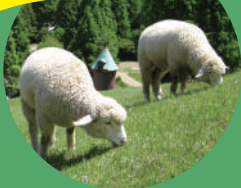
神戸市立 六甲山牧場