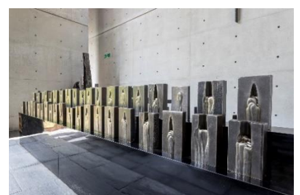
榎忠《End Tab (エンドタブ)》 2019年 風の教会