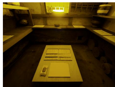
「あなたの虹を描いてください。」 藤沢今昔まちなかアートめぐり 2018