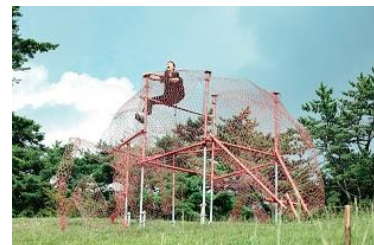
「Exuvia」六甲ミーツ・アート 芸術散 2019