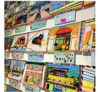
「兵庫景」展示風景 2019