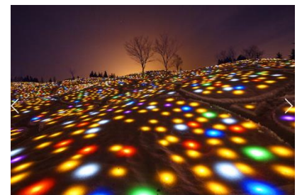
「Gift for Frozen Village 2019 -光の花畑-」