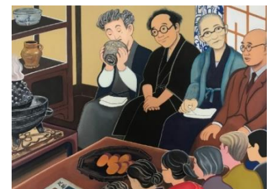
「民藝館の茶会」2019 西治コレクション蔵