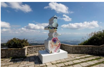
植松琢磨《world tree II》 2019年 六甲ガーデンテラス

六甲山のエリア特性をじっくりと読み込み、自然や景観、歴史を採り入れた作品を各会場に展示します。