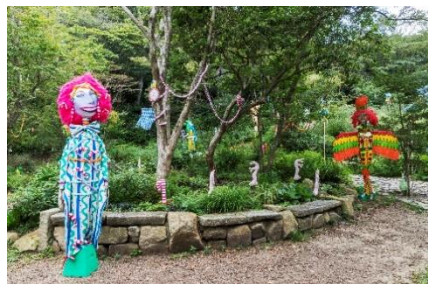
秦まりの《MAHOU NO MORI》 2019年 六甲オルゴールミュージアム