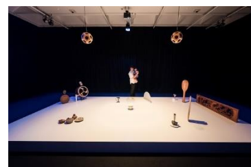
「TALKING LIGHTS」2016 Courtesy of IPPONGI PRODUCTION, 高松市美術館、photo:永禮 賢