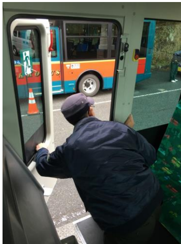
(非常口点検・処置訓練)