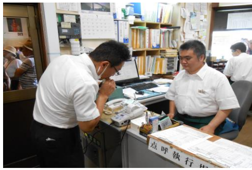
(アルコールチェック)