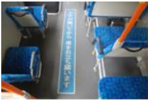
(車内転倒防止対策:床面に注意喚起シール貼付け)