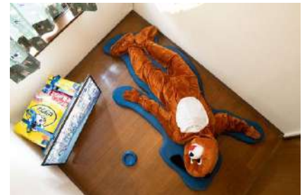
《犬死のトレーニング》2021年 黄金町バザール 2021 トモトシ