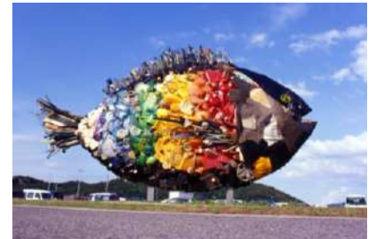
「宇野のチヌ」2010年 (岡山県玉野市宇野港)