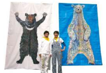
《パタント絵『ツキノワグマ』とパタント絵『シロクマ』》2020年 諏訪山動物園アートぶろじえくと/ 神戸