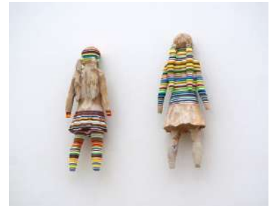
《闘う女-複製1、2》2020年 (彫刻の壊れ MA2Gallery)