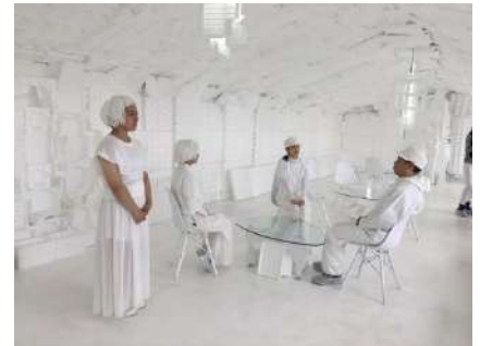
《スペースホワイトカフェ》 六甲ミーツ・アート芸術散歩 2017