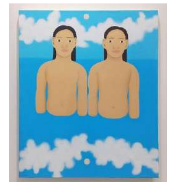
《枝》2021年 UNKWON ASIA 展示風景