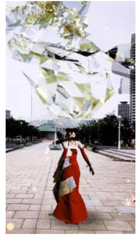
「technopera」 「AR オペラ TECHNOPERA」 2021 年 メリケンパーク (兵庫)