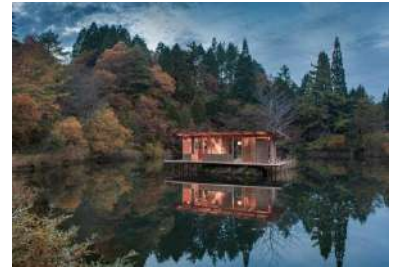
《六甲美術館》2017年 六甲ミーツ・アート 芸術散歩 2017