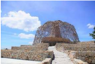
自然体感展望台 六甲枝垂れ

「六甲ミーツ・アート芸術散歩」は、六甲山上の観光施設を主な会場としています。オープンエアな環境で六甲山の自然とアート作品を楽しみながら、会場となる各施設それぞれの魅力もお楽しみいただけます。各会場は、六甲山上バス（路線バス：有料）の他、徒歩での移動も可能です。