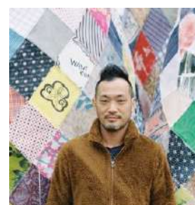
淀川テクニック

※本年は招待・公募アーティスト含め約40組が出展予定です。 各アーティストのプロフィールは次頁をご確認ください。