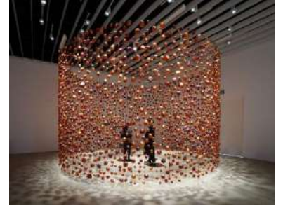
《石と柵》2022 KYOTO STEAM 2022 国際アートコンペティション 京都市京セラ美術館 東山キューブ