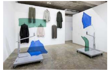
個展「線を重ねる」 (Yumiko Chiba Associates viewing room shinjuku、2021年)