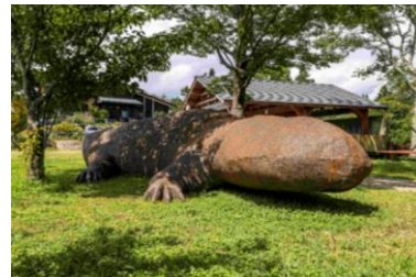
六甲ミーツ・アート公募大賞 準グランプリ作品 鐵羅佑《かすむ》2021年 記念碑台