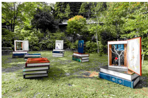
穂波梅太郎《僕の話》 2021年 六甲高山植物園