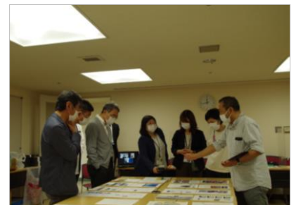
公募審査会の様子

※参加する場合は参加希望日の3日前までにお申込みください。詳しくは公式Webサイトをご確認ください。