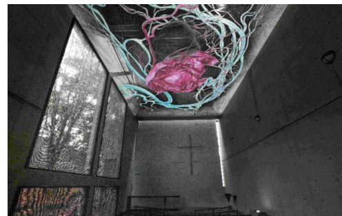
束芋《オクユク》 2021年 風の教会