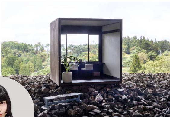
六甲ミーツ・アート公募大賞 グランプリ作品 上坂直《六甲景鏡》 2020年 自然体感展望台 六甲枝垂れ