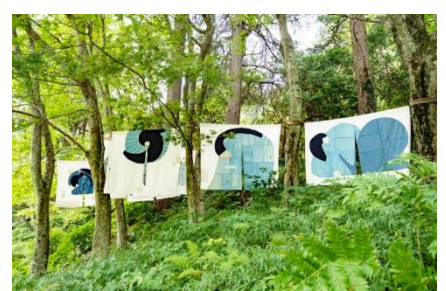
史枝《連なる思い》 2020年 六甲高山植物園