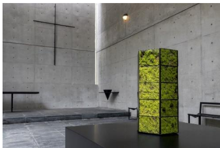
山城大督《『Monitor Ball』ver. Rokko》 2020年 風の教会

六甲山のエリア特性をじっくりと読み込み、自然や景観、歴史を採り入れた作品を各会場に展示します。