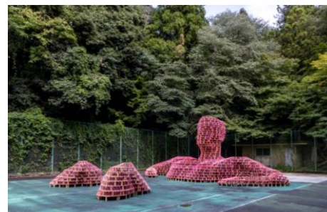
木村剛士《戻れない、過去に浸る日もあっていい》 2020年 サテライト会場:有馬温泉エリア