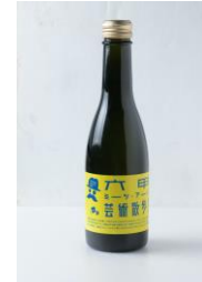
アフタヌーンティーセット(やまみつパイ・レモネード)