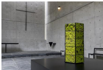
山城大督《Monitor Ball》ver. Rokko》 2020年 風の教会エリア