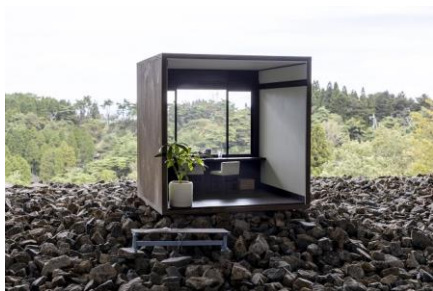
上坂直《六甲景鏡》 2020年 自然体感展望台 六甲枝垂れ

六甲山のエリア特性をじっくりと読み込み、自然や景観、歴史を採り入れた作品を各会場に展示します。