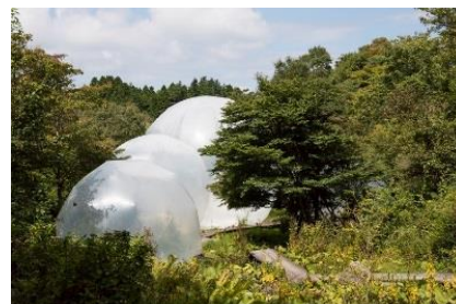
奥中章人《Inter-world-sway》 2017年 六甲オルゴールミュージアム