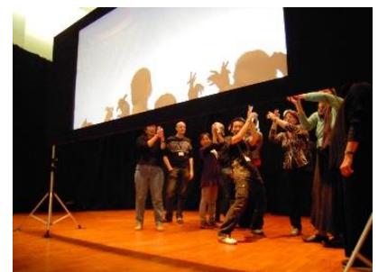
劇団かかし座「手影絵体験ひろば」

劇団かかし座による、手影絵の生パフォーマンスの公演を行います。手と身体だけで次々と展開する手影絵を、ライブで楽しめます。