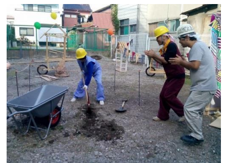
大木土木とミツヤ電機 おしゃまなユンボワークショップ『土木イメクラ』

＜詳細は、2ページ目をご覧ください。また上記以外にも、様々なイベントを開催予定です。 最新情報は、随時 web ページ( www.rokkosan.com/art2018/ )にてアップいたします。＞