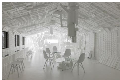
開発好明《スペース・ホワイト・カフェ(SWCafe)》 2017年 天覧台