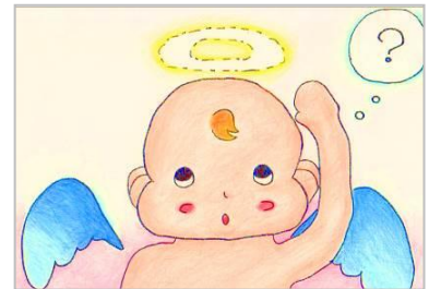
松蔭中学校・高等学校美術部 「がんばれ！てんしろうくん！」

石職人である作家による、自然の石を絶妙のバランスで積み上げて作品を作る石積みワークショップです。気に入った石を思い思いにデザインして遊ぶことができます。 ※作品はお持ち帰りできません。