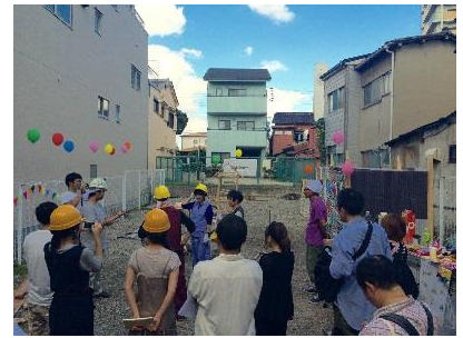
大木土木とミツヤ電機 おしゃまなユンボワークショップ『土ホイメクラ』

高校生による参加型パフォーマンスを開催します。作品である「てんしろうくん」の天使の輪をみんなで作る体験ができます。