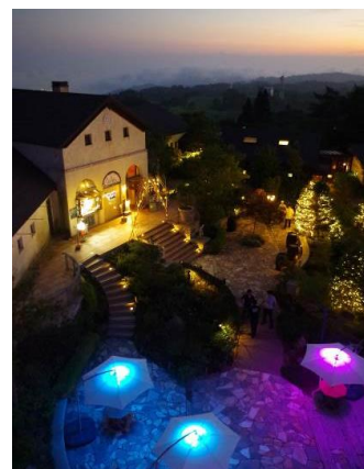
Summer Lighting Night Cafe

六甲ミーツ・アート芸術散歩 2018 の開催概要については次ページをご参照ください。