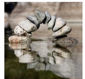
榮建太郎「ストーンバランシング・ワークショップ」

劇団員の指導のもと手影絵が体験できるワークショップです。お子様はもちろん、大人の方も楽しめる内容です。