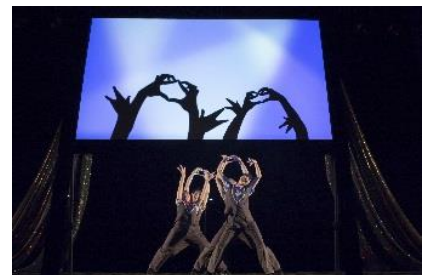
劇団かかし座 手影絵パフォーマンス

資料に関するお問い合わせ先 六甲ミーツ・アート 芸術散歩 2018 事務局 六甲山観光株式会社 営業推進部 広報担当 E-mail: press@rokkosan.com TEL: 078-894-2210（平日9:00～18:00）／ FAX: 078-894-2088