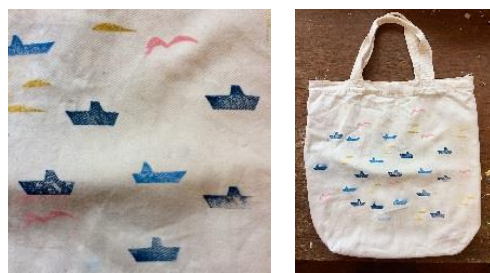
森太三「“海の風景エコバック”を山でつくろう！」