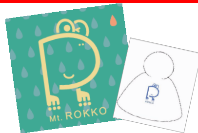
レインコート作りのワークショップ(イメージ)