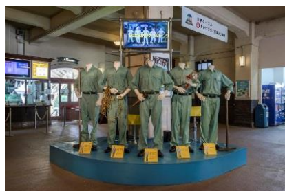
明和電機《ひっぱれ! 六甲ケーブルカー》 2017年 六甲ケーブル

六甲山のエリア特性をじっくりと読み込み、自然や景観、歴史を採り入れた作品を各会場に展示します。