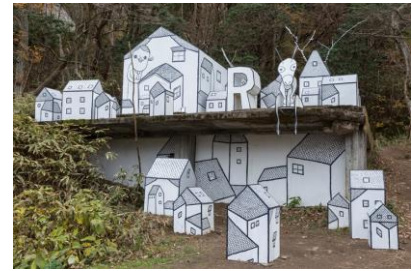
三宅信太郎 《山頂の街》